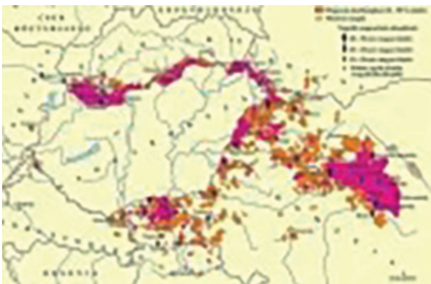
2. ábra: A trianoni békediktátum következtében „határon túlra”kényszerített magyarok.