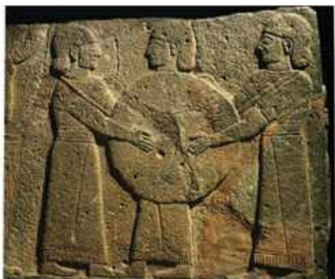
Dobosokat ábrázoló dombormű, Karkemis Ankara, Anatóliai civilizációk Múzeuma i.e. XII. század