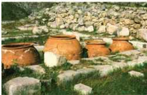
Hattusa, Alsóváros temploma, néhány amfórával