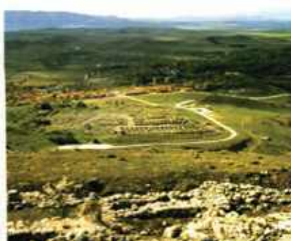
Hattusa fellegvár, Fellegvár Alsóváros romjai