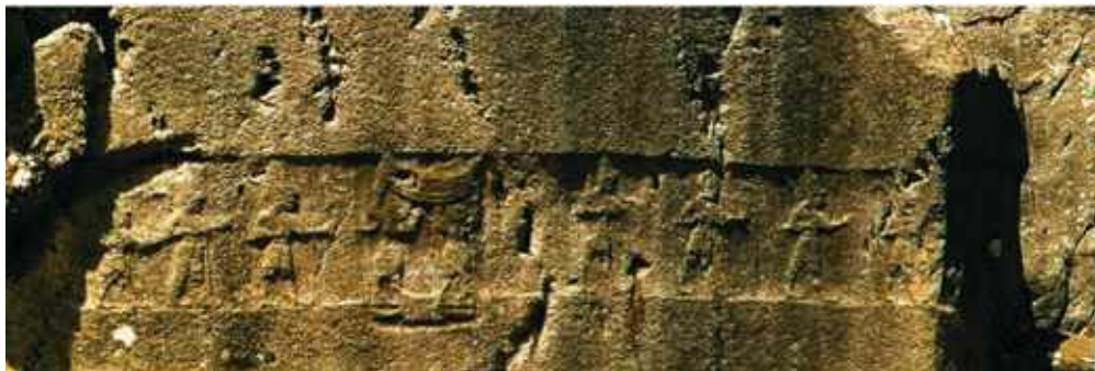
Yazylycala, Istenségek felvonulását ábrázoló dombormű i.e. XIV. – XIII. század