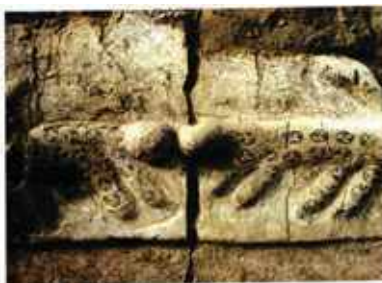
Leopárdokat ábrázoló dombormű, Catal Hüyük, i.e. VII.-VI. évezred, Ankara