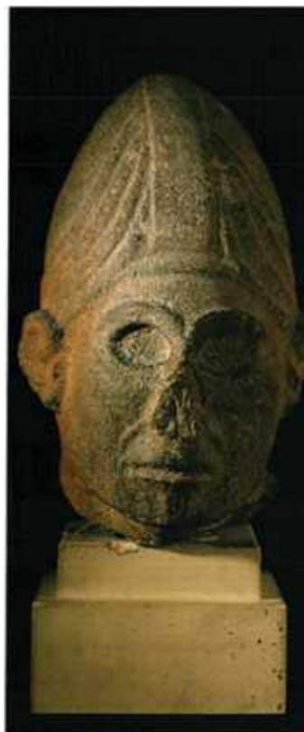
Pásztoristen ábrázolás, Louvre Aleppó vidékéről, i.e. XVI.- XV. század