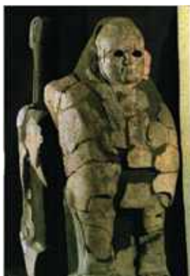
Hattusa, Déli kapu szfinx szobor, i.e. XIV. – XIII. század, Isztambul, Régészeti Múzeum