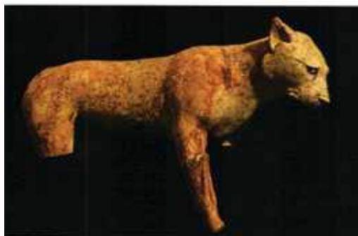
Terrakotta szoborcška Nöstény oroszlán, i.e. XIII.-XII. évszázad, Qufa