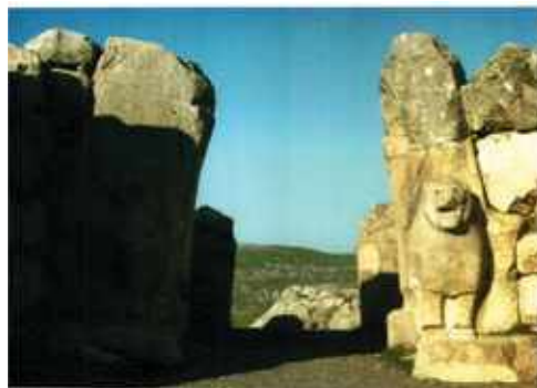
Hattusa, Oroszlánok kapujának látképe, i.e. XIV. – XIII. század