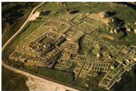
Hattusa, Alsóváros légi felvétele, 1. számú templom a raktárépületekkel