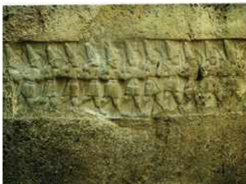
Yazylycala, 12 görbe karddal a kezében menetelő, csúcsos süveget viselő istenségeket ábrázoló dombormű i.e. XIV. – XIII. század