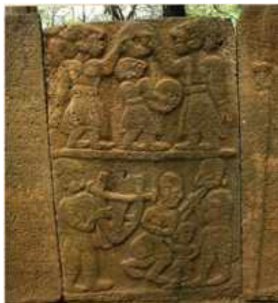
Kara-Tepe, Déli kapu, Zenészeket ábrázoló dombormű Törökország, XII. század