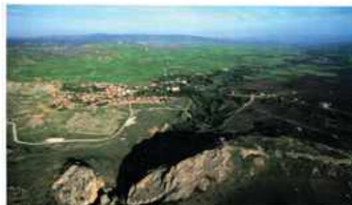
Hettita főváros, Hattusa Törökország, Hattusa romjainak látképe