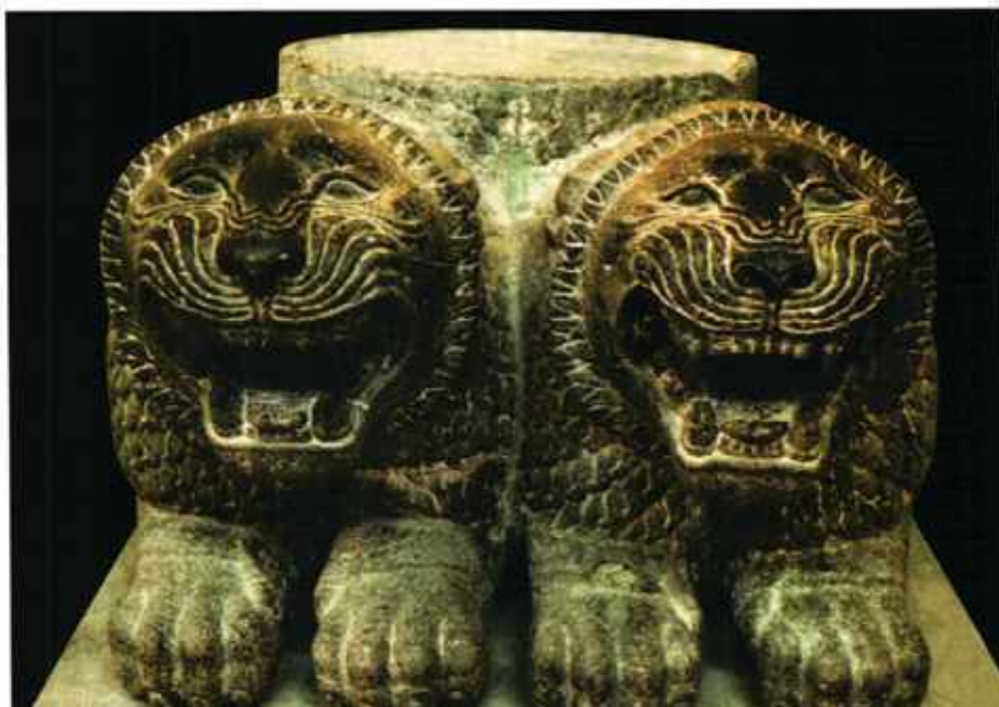
Tel-Tianat, Oszlop lábazat oroszlán párral Antakya, Régészeti Múzeum i.e. XII. – XI. század