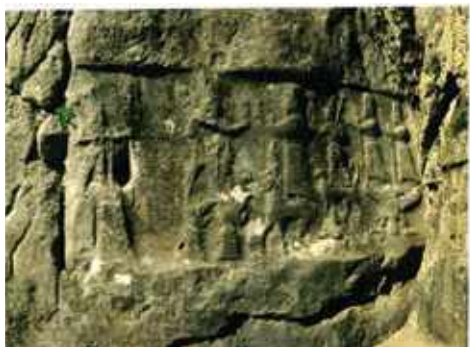
Hattusa, Királyi kapu látképe, i. e. XIV. – XIII. század