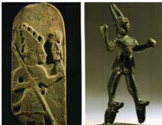
Vihar Isten és Harcos Ankara – Louvre i.e. XIV.-XIII. század