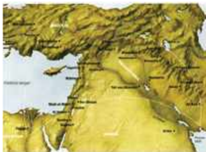
Térkép részlet, Termékeny-Félhold