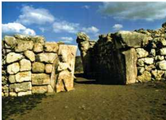
Hattusa, Királyi kapu látképe, i. e. XIV. – XIII. század