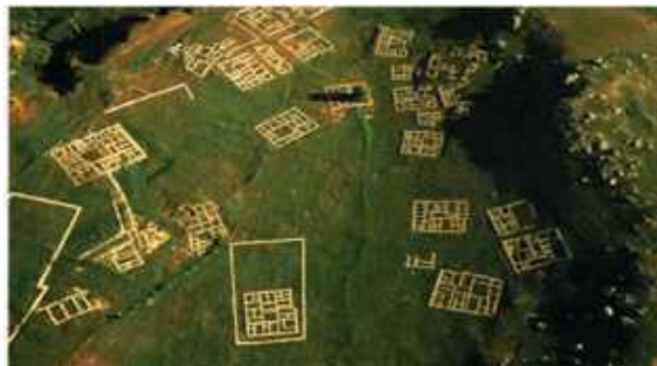
Hattusa fellegvár, Bogaz – Köy felől nézve Felsőváros romjai