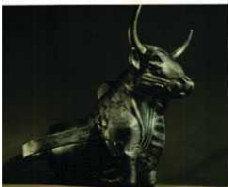
Összekuporodó bika, Ivóedény, i.e. XIV. század, Hattusa Norbert Schimmel gyűjtemény