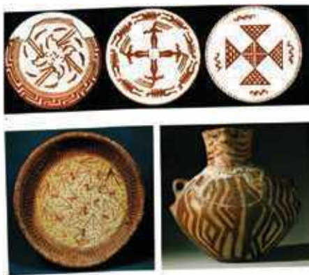
Kerámia edények Samarra kultúra, i.e. VI. évezred