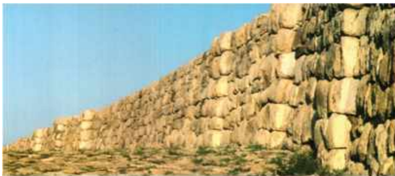
Hattusa, Felsőváros városfalának egy szakasza