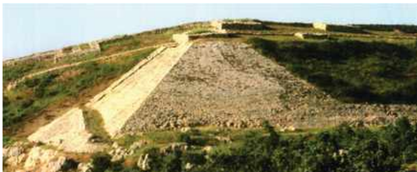
Hattusa fellegvár, Felsőváros falainak és bástyáinak látképe