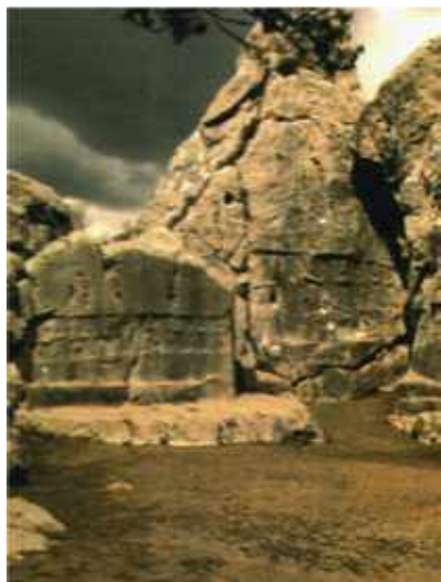
Yazylyqala, Törökország i.e. XIX.-XIII. század, Tesub és Khebat találkozását ábrázoló jelenet