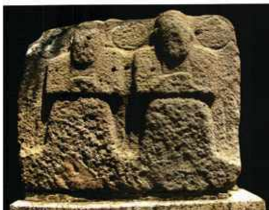
Yesemek, Dombormű a hegy génuszaival i.e. XIII. – XII. század