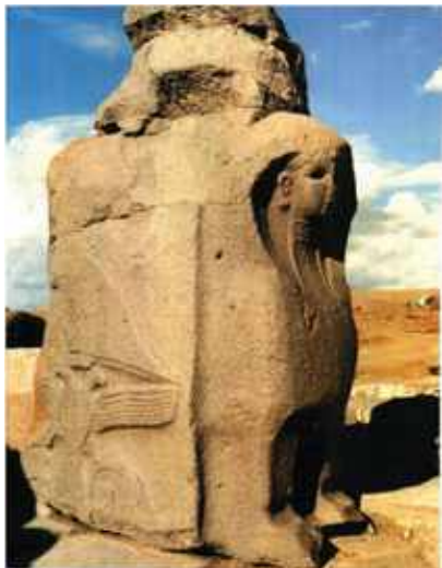
Alaca Hüyük, Szfinx kapuja, i.e. XIV. – XIII. század