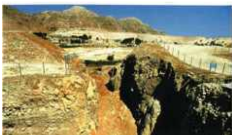
Tell őr bástya, Filisztia, i.e. IX. évezred, pásztor népek