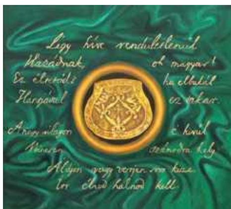
Szózat festménysorozat 8. kép Tiszabezdédi tarsolylemez mandala (olaj, farost, 95 X 105 cm)