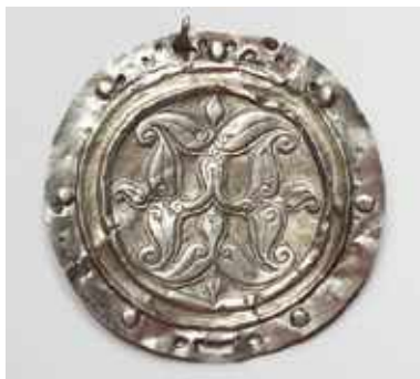
Hajfonatkorong Csengele határából 10. sz. (Móra Ferenc Múzeum, Szeged)

Honalapító ősünk tehát elsősorban nem a látványban megnyilvánuló esztétikai értéke miatt alkalmazták a szent lótusz szimbólumot a hajfonatkorongokon, tarsolylemezeken, ruhadíszeken, hanem amiatt, mert hittek annak belső tartalmában, gyógyító erejében, védelmező képességében, spirituális tartalmában.