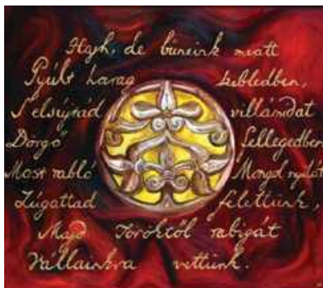
Himnusz festménysorozat 5. kép Sárospataki mandala (olaj, farost, 95 X 105 cm)

A Tiszabői mandala című festményem központi témája az egykori hajfonatkorong mintázata, mely négy színű háttéren nyugszik. A háttér celláiban a Himnusz második versszaka olvasható rovásírással: „Őseinket felhozád Kárpát szent bércére, általad nyert szép hazát Bendegúznak vére. S merre zúgnak habjai Tiszának, Dunának, Árpád hős magzatjai felvirágoznak.”