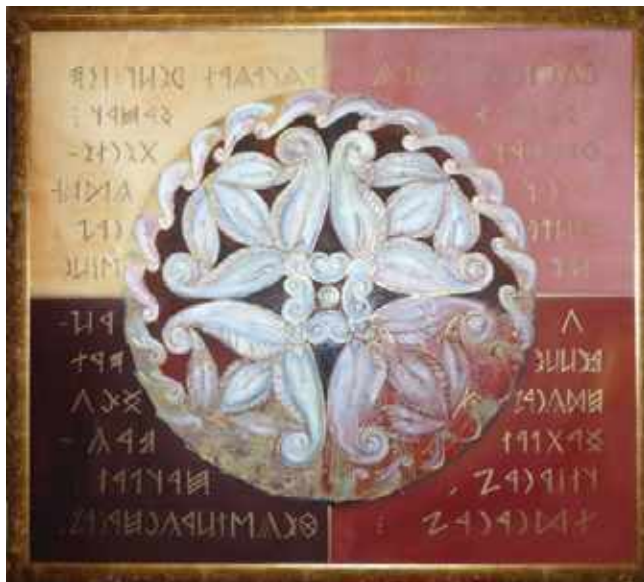
Tiszabői mandala (olaj, farost, 95 X 105 cm)

A lélekre gyakorolt gyógyító hatását a tudomány is bizonyította, többek között Carl Gustav Jung, svájci pszichiáter is sikerrel alkalmazta a lélekgyógyászatban. Mandala – Képek a tudattalanból című könyvében a mandala célját ekként határozza meg: „... az összpontosítást hivatott elősegíteni a pszichés látótérnek a központ felé való, mintegy körkörös szűkítésével” 1 . A kör külső sávját szinte mindig a tűz alkotja. Befelé haladva a lótuszvirág-koszorú következik, ami a mandala lehangsúlyosabb eleme. Belül a kolostorudvar négy falát idéző szent négyes zártság következik, mely az összpontosítás helye. A négy szín utalhat a négy égtájra, csakúgy, mint a jungi tipológia szerinti négy pszichés funkcióra is: gondolkodás, érzés, érzékelés, intuíció. Ezt követi a centrum, amely a kontempláció tulajdonképpeni tárgya, avagy célja. Ez a központ jelenti a világteremtő kisugárzását, az időtlent a maga tökéletes állapotában.