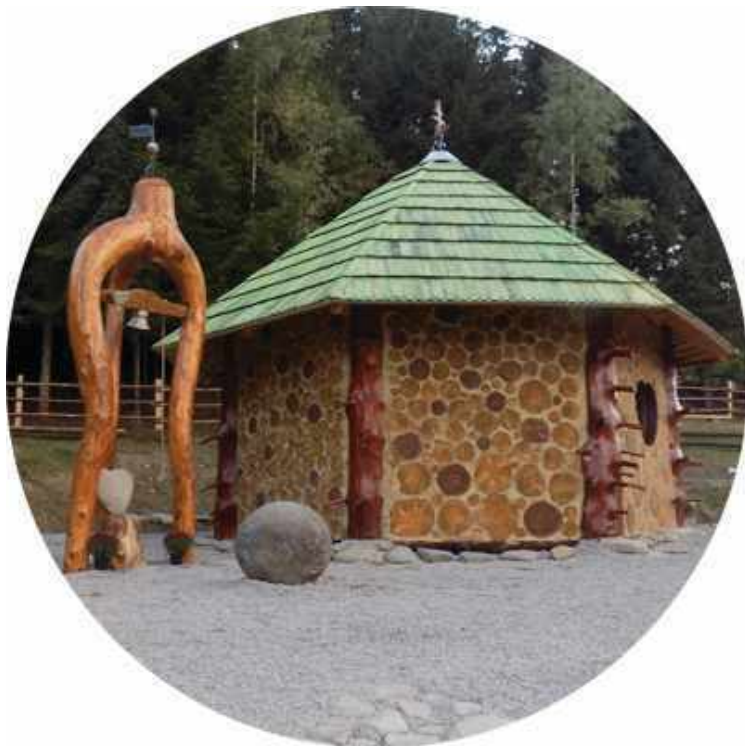
Nagy Balázsék kertjében épített Gyümölcsoltó Boldogasszony kápolna, Úz völgye, Csinódon.

Daczó Árpád - Lukács Atya - erdélyi Ferences szerzetes „Csiksomlyó titka Mária-tisztelet a néphagyományban” című könyvében olvashatók az alábbi sorok: