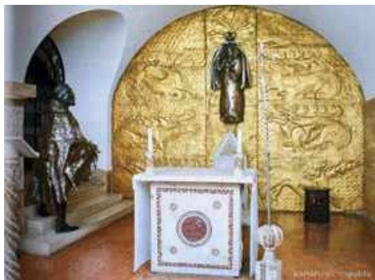
Szkíta oltár a Vatikán alagsorában - a vatikáni Magyar kápolna

A jövődölések valós bizonyosságáról beszélt II. János Pál pápa is: „A Vatikán szigorúan őrzött iratainak nyilvánosságra hozatala megrendíti majd a magyarság valós őstörténetét. El fog jönni az az idő, amikor őszinte tisztelet és csodálat fogja övezni a magyarságot.”