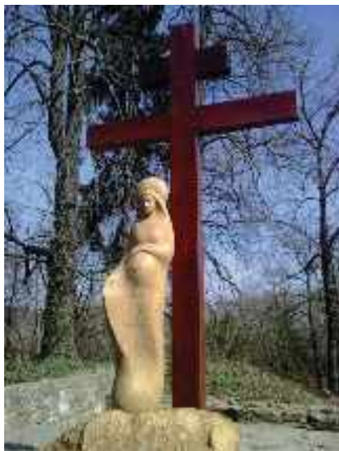
Áldott állapotban lévő Gyümölcsoltó Boldogasszony szobor, a Budaszentlőrinci Pálos kolostorromoknál

Budapesti ünnepség a fenti link címen, a Budaszentlőrinci Pálos kolostorból közvetítve