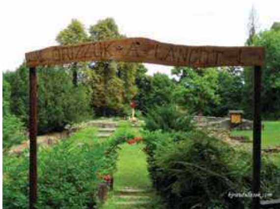
Budaszentlőrinci pálos kolostorromok bejárata

Az a fa kapu pedig, mely ott áll a bejáratnál több ízben kidőlt, s Mihály családjával együtt mindig felállította. A kapun lévő felirathoz híen: Őriz-zük a lángot! Töretlen hittel, ISTENTŐL KárpátHaza Magyarorszáát örökké megtartó Szent Koronában kapott Szeretet törvényét, mely szerint élünk és adjuk tovább a felnövekvő nemzedéknek.