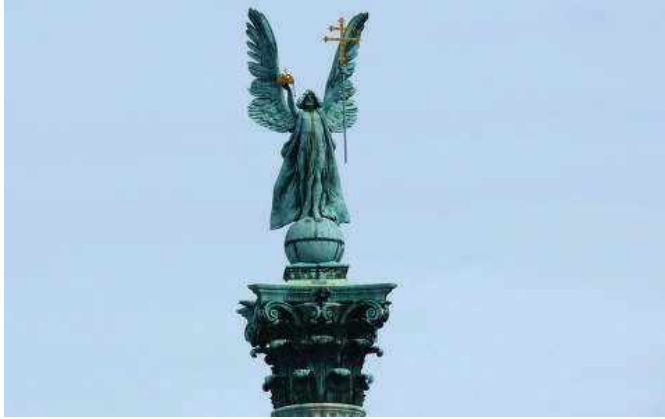
Gábrriel a Magyarság őrző Angyala, a Szent Koronával és a kettős kereszttel

Hagyományainkra épült értékek mentén kell kiállni, a hitet erősíteni, mert különben nincs erkölcsi, a kezdetektől örökké Keresztény Hazánkat megtartó erő, a Nők tiszteletéért a családokért, Hazánk, Európa és a földön élő Nemzetek megerősödéséért, a Világbékéért!