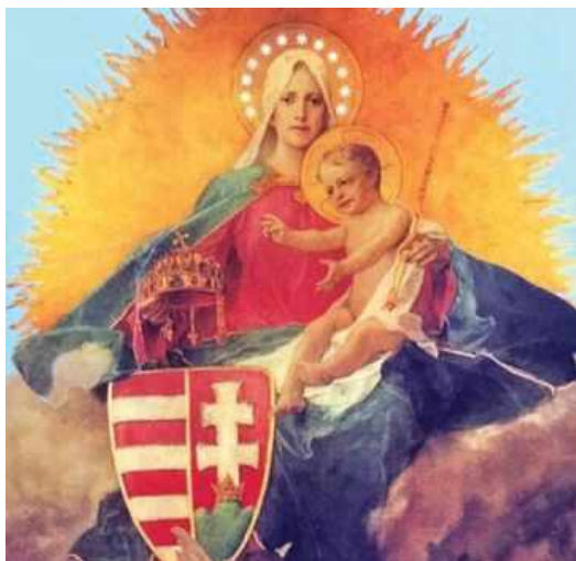
Regnum Marianum - Magyarok Nagyasszonya, a Világ Győzelmes királynője

Isten teremtette Földön, a Magyarot erős Hitben megtartó Mária - a Magyarok Királynő Nagyasszonya, Keresztény ősi hagyományok követése nélkül, nincs Család, Haza s Nemzetek. Közös erővel szülessük újjá Regnum Marianum, Mária Országát s bizton mondhatjuk, hogy minden Magyar Érték a Magyar érdekeket fogja ismét szolgálni. Vigyázzuk, óvjuk Boldogasszony Anyánk oltalmában Édes Hazánkat. Kérjük Áldását KárpátHazánk Magyarországra, a Nőkre, a Magyar Népre a Világbékére.